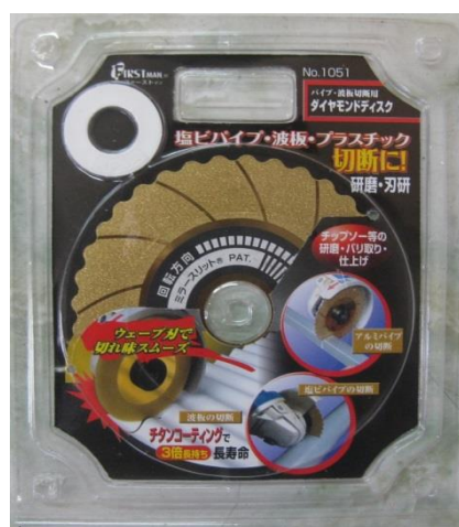
波板の切断 イメージ